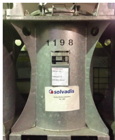
Unser Perchlorethylen S (Frischware) lagern wir ausschliesslich in Sicherheitsbehältern.

Wir erstellen gerne unverbindlich ein scharf kalkuliertes Angebot für Ihre geschlossene Reinigungsanlage oder beraten Sie persönlich vor Ort.