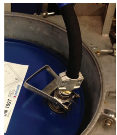
Die Befüllung und Entleerung erfolgt geruchslos über unsere Spezialkuppelung.